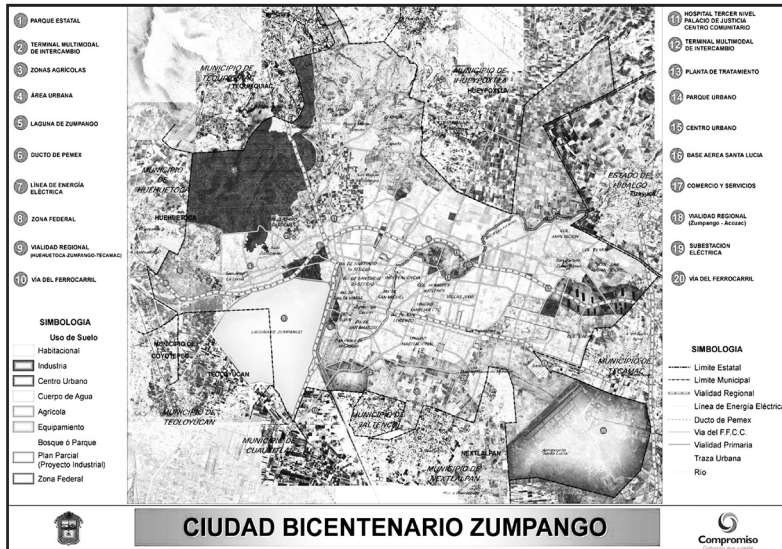
Figura 3. Ubicación de la Nueva Ciudad Zumpango